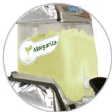
Decoración cóctel de margarita