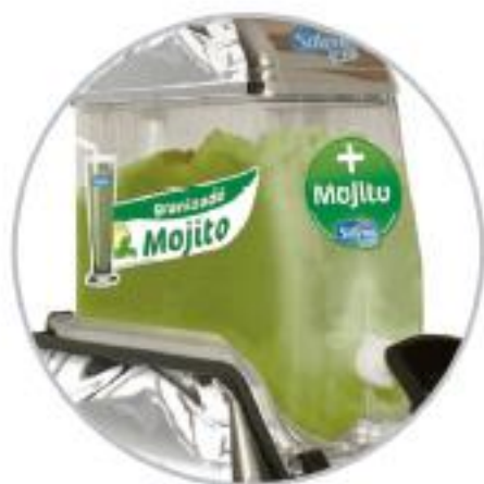
Decoración granizado de mojito

Ahora, si consumes productos Solera, al comprar una máquina te mandamos la decoración o te la mandamos decorada con el producto que consumes.