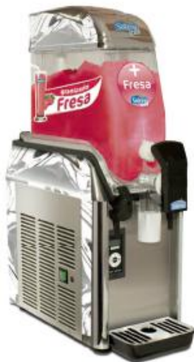
Decoración disponible en todos los sabores