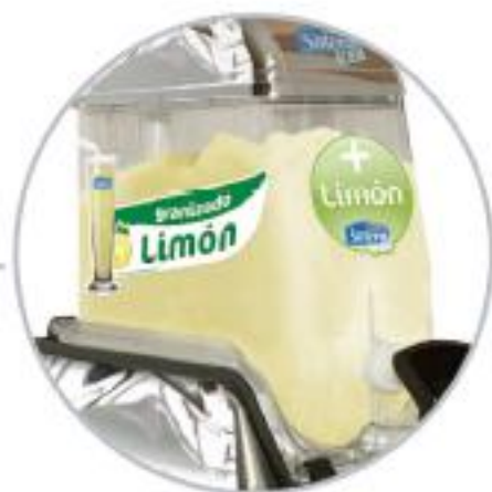
Decoración granizado de limón