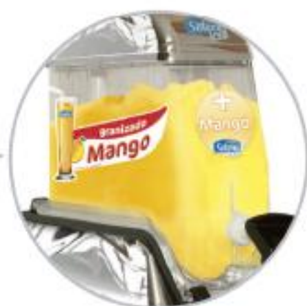
Decoración granizado de mango